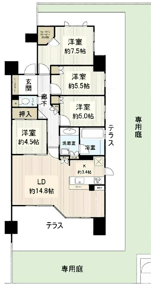
専有面積の広さ、専用庭、採光の良さが特徴