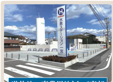
遊休地→事業用地として売却