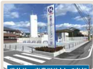
遊休地→事業用地として売却