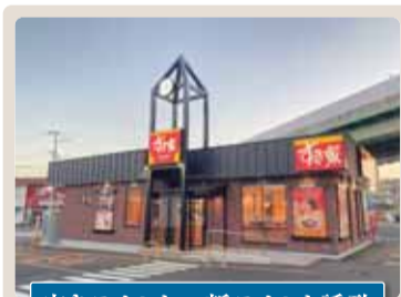
空きテナント→新テナント誘致