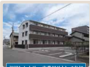
相続した土地→事業用地として売却