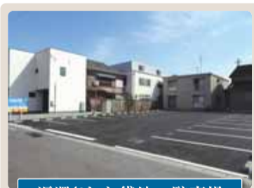
返還された貸地→駐車場