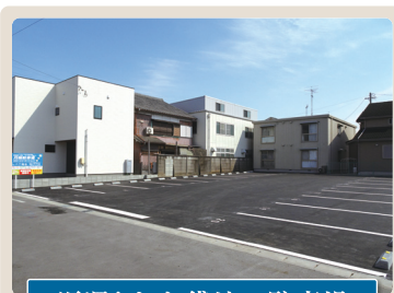
返還された貸地→駐車場