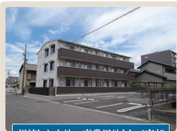
相続した土地→事業用地として売却