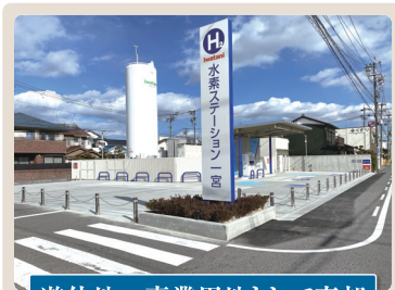
遊休地→事業用地として売却