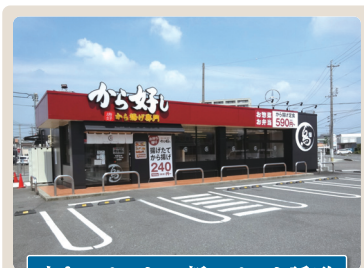
空きテナント→新テナント誘致