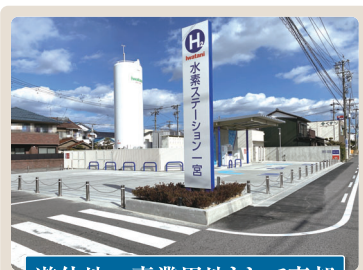
遊休地→事業用地として売却