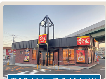
空きテナント→新テナント誘致