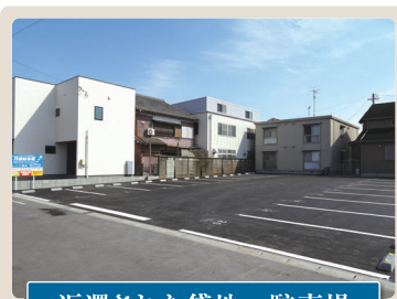
返還された貸地→駐車場