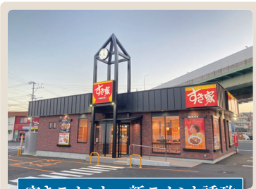
空きテナント→新テナント誘致