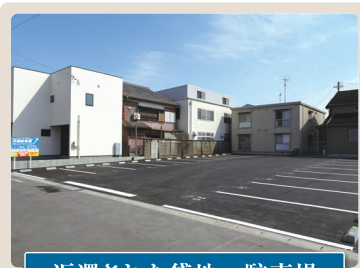
返還された貸地→駐車場