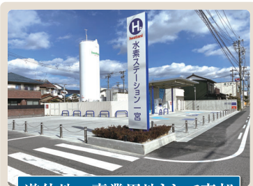
遊休地→事業用地として売却