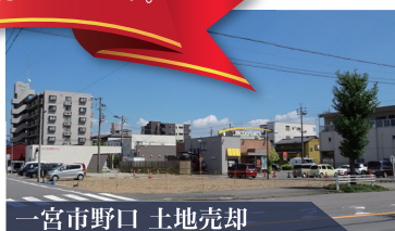
一宮市野口 土地売却