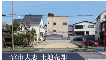
一宮市大志 土地売却