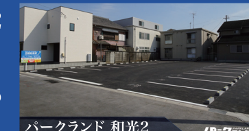
パークランド 和光2