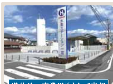
遊休地→事業用地として売却