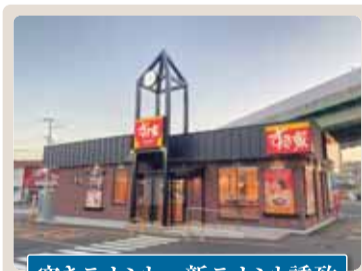
空きテナント→新テナント誘致