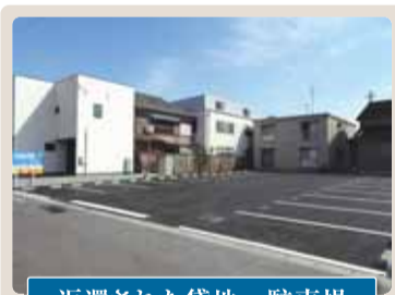
返還された貸地→駐車場